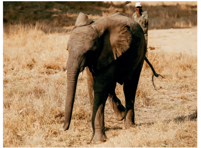
Limpopo und Kadiki