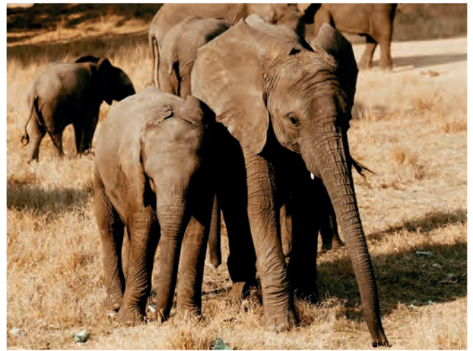
Kadiki und Coco