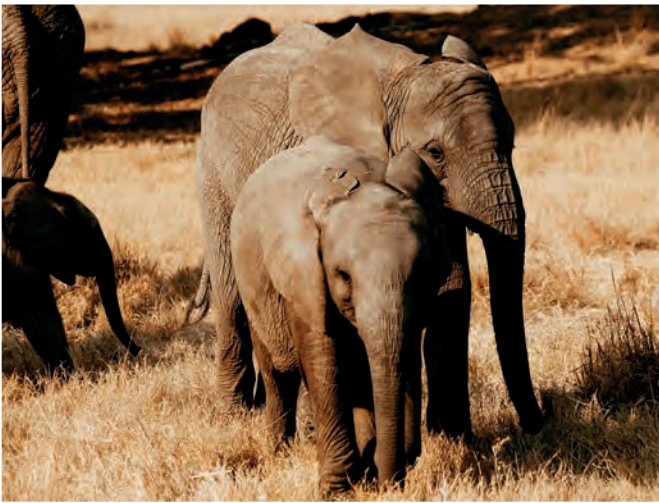
Kadiki und Coco

Neuigkeiten Elefantenwaisenhaus ZEN Zimbabwe Elephant Nursery, Harare – 11/2022