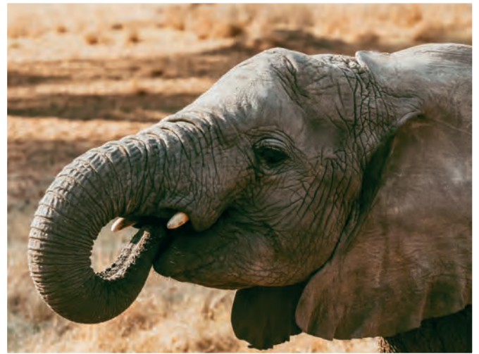
Unity – Sally – Coco