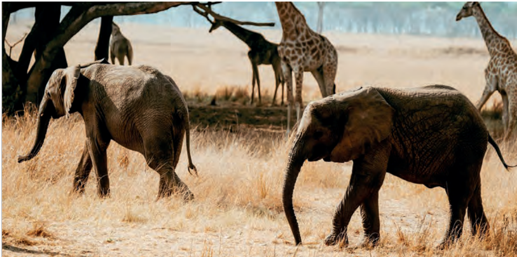
Unity und Bumi